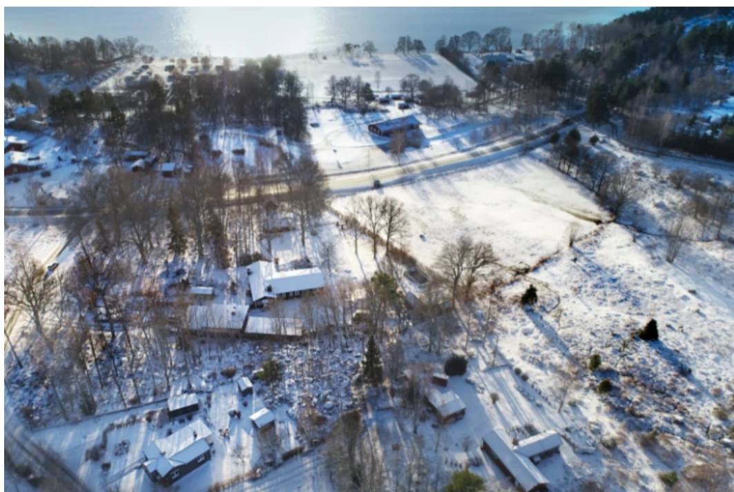
Sandviks camping, på sluttningen ner mot vattnet, skulle enligt detaljplanen få byggas ut med 15 stugor. Sommarstugorna längre upp skulle få byggas ut till 100 kvadratmeter.

Vi har utan framgång sökt det ansvariga kommunalrådet Muharrem Demirok (C) för en kommentar.